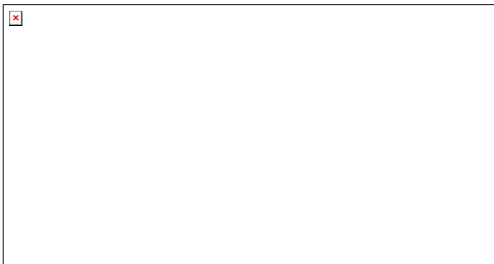
Rysunek 1. Pole dobrego uziarnienia kruszyw przeznaczonych na podbudowy wykonywane metodą stabilizacji mechanicznej.

Do wykonania podbudowy należy zastosować kruszywo o uziarnieniu 0/31,5 mm.