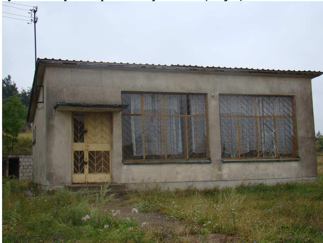
Rysunek 2 Budynek GS przeznaczony na świetlicę wiejską

We wsi Butrymowce znajduje się budynek po byłym sklepie Gminnej Spółdzielni, który po wykonaniu generalnego remontu można będzie wykorzystać do zorganizowania w nim wiejskiej świetlicy. Po przeprowadzeniu remontu obiekt ten służyłby dla potrzeb mieszkańców tej wsi (np. zebrania wiejskie, spotkania towarzyskie, itp.)