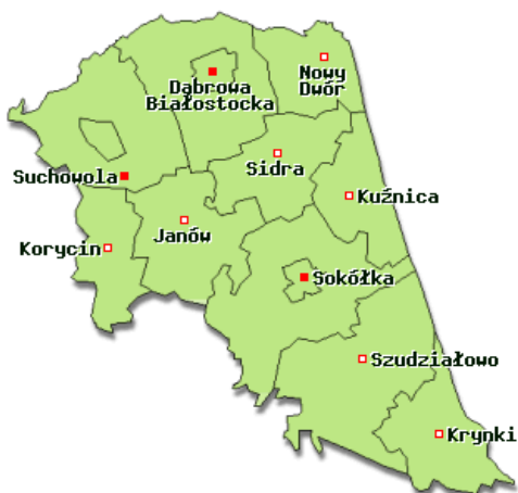
Rysunek 1 Położenie gminy Nowy Dwór w powiecie sokólskim i położenie wsi Butrymowce w gminie Nowy Dwór